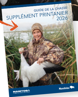
Photo soumise pour la page couverture