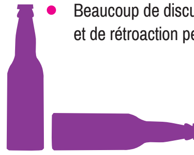
Plus de deux consommations par jour ou plus de 10 consommations par semaine