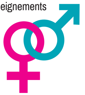
Actives sexuellement avec un partenaire masculin